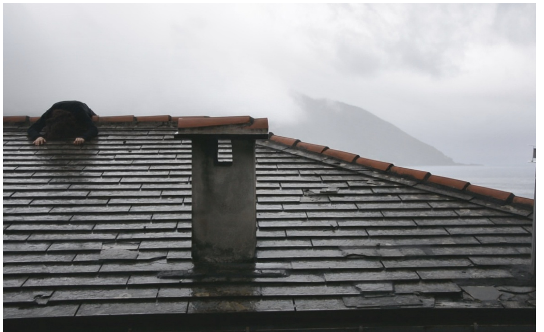
Tentativo n. 2 (rivolta) 2017 video 1' 28''